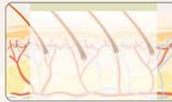
Während der Behandlung mit LEO Technologie