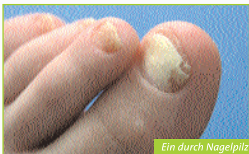
Ein durch Nagelpilz verfärbter und brüchiger Nagel

Bei einer Nagelpilzerkrankung verfärbt sich die Nagelplatte gelblich bis dunkelbraun, selten auch grünlich oder schwarz. Zudem verdickt sich der Nagel und wird brüchig. In den umgebenden Hautpartien kann zusätzlich ein unangenehmer Juckreiz auftreten.