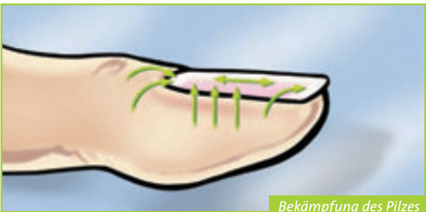
Bekämpfung des Pilzes von innen heraus

Der antimykotische Wirkstoff bekämpft von dort aus wirksam den Pilz. Zudem lagert er sich in den wachsenden Nagel ein, so dass neu gebildetes Nagelmaterial nicht mehr befallen werden kann.