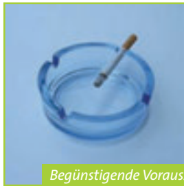
Begünstigende Voraussetzungen für Nagelpilzkrankungen